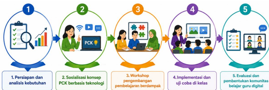
Diagram Alir Program sosialisasi PCK Berbasis Teknologi Untuk Pembelajaran Berdampak

Metode pelaksanaan program sosialisasi ini dirancang secara sistematis menggunakan pendekatan participatory action research yang melibatkan mitra secara aktif dalam setiap tahapan (Kemmis, 2005; Stringer & Aragón, 2020). Pendekatan ini dipilih karena memungkinkan kolaborasi antara peneliti dan praktisi dalam mengidentifikasi masalah serta mengembangkan solusi secara bersama-sama (Mertler, 2024). Program dilaksanakan dalam lima tahapan utama yang saling berkesinambungan selama 3 minggu dengan follow-up dua bulan sesudahnya. Untuk memberikan gambaran menyeluruh tentang alur pelaksanaannya, berikut disajikan diagram alir program sosialisasi PCK Berbasis Teknologi untuk Pembelajaran Berdampak