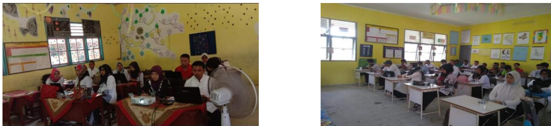
Gambar 1. Guru membuat prodak

reflektif yang memandu guru dalam mewujudkan PCK ke dalam produk pembelajaran konkret, dan prinsip inilah yang diadaptasi sebagai kerangka workshop dengan template yang disesuaikan Kurikulum Merdeka.